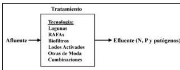
Figura 1. El paradigma lineal aplicado en la cuenca del Lago Atitlán